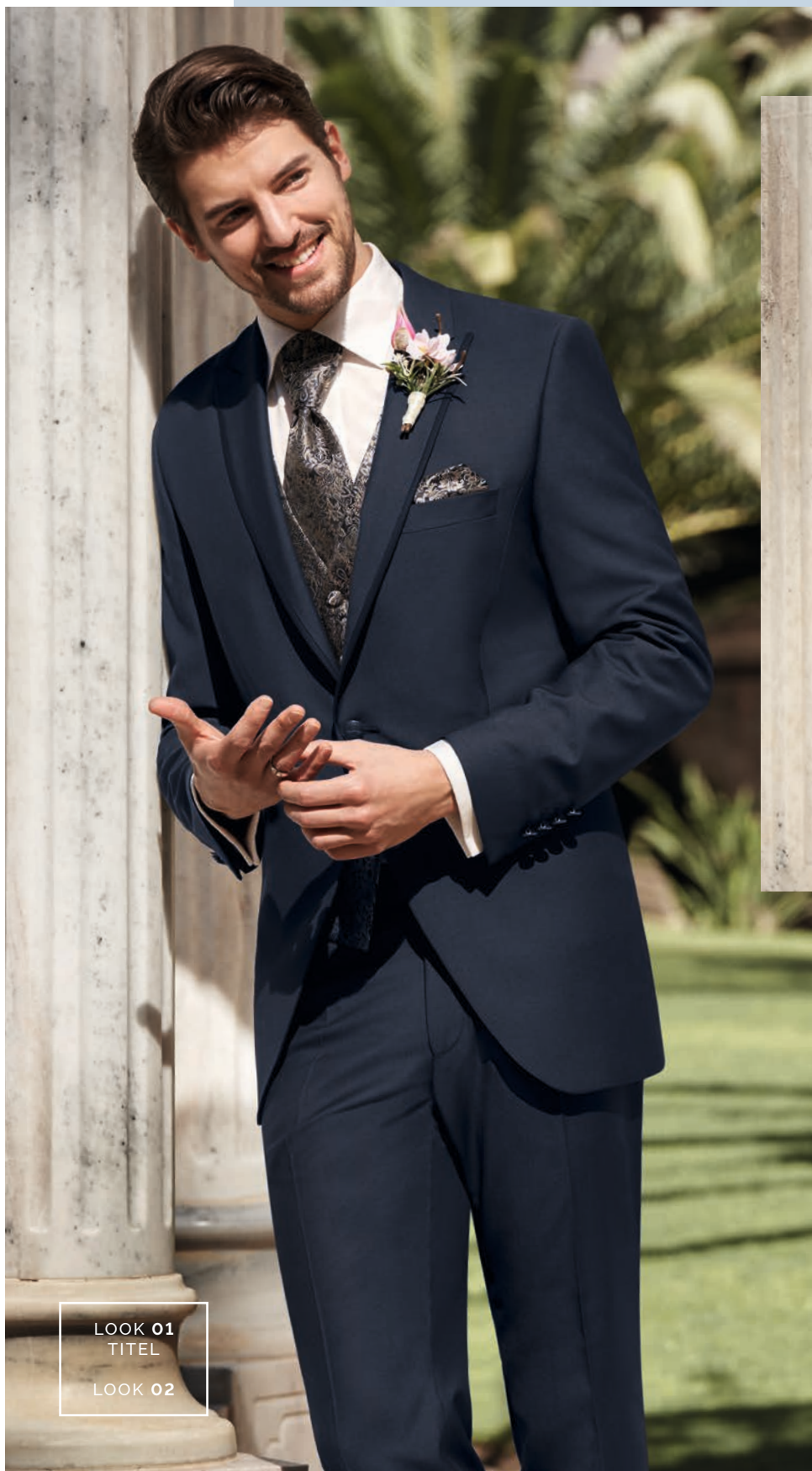
LOOK 01 TITEL